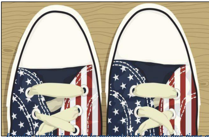
Estados Unidos importa la mayoría del calzado que tiene a la venta y el 72% proviene de China.

Si compras tu calzado en Estados Unidos, puede que pronto te salga más caro.